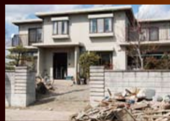
宮城県多賀城市内で無傷の状態に残るWPC住宅