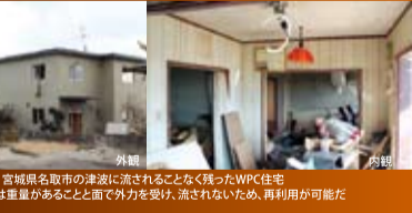
宮城県名取市の津波に流されることなく残ったWPC住宅 WPC住宅は重量があることと面を外力を受け、流されないため、再利用が可能だ

東日本大震災において被害を受けられた方に心よりお見舞い申し上げます。観測史上最大のM9の大地震は東北地方に大きな被害をもたらしました。「巨大地震にも壊れない家」がいかに大切かを痛感しています。WPC鉄筋コンクリート住宅の百年住宅は、阪神大震災や中越地震等、あらゆる地震での揺れには無傷を誇っています。近い将来発生するとされている東海地震にも無傷を目指しています。当社の企業理念は「災害から命と財産をお守りすること」です。