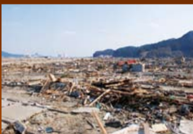
すべての住宅が津波によって流れ、瓦礫の山に...