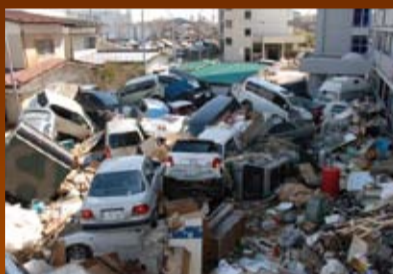
津波に押し流されマンションの駐車場にたまった車の山