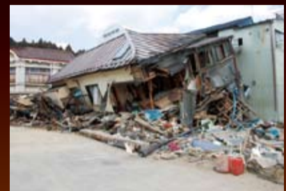
ツーバイフォー住宅を含め、木造住宅の多くが津波で破壊された。陸上部分で乗用車並みの速さを持つ津波の威力の前に、木造の柱は折れ曲がる。