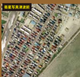
衛星写真津波前 津波が襲う前の宮城県名取市閑上地区 そこには当たり前の生活があった