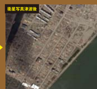
衛星写真津波後 津波が襲った後の宮城県名取市閑上地区 すべてが流された...