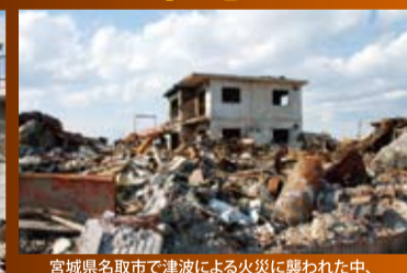
宮城県名取市で津波による火災に襲われた中、コンクリートの壁は燃えないため、唯一残ったWPC住宅