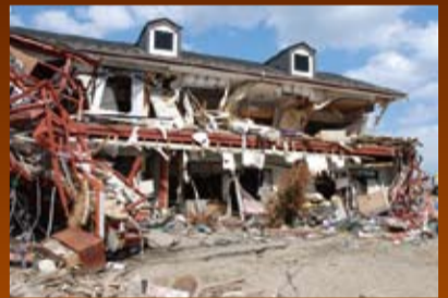
軽量鉄骨住宅は津波の前になすべもない。その名の通り軽量のため剛性がなく、津波の外力に対し簡単に変形し、原形をとどめていない。