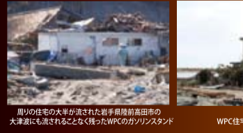
周りの住宅の大半が流された岩手県陸前高田市の津波にも流されなかったWPCのガランスタンド