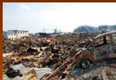
津波による火災によって焼失した宮城県気仙沼市