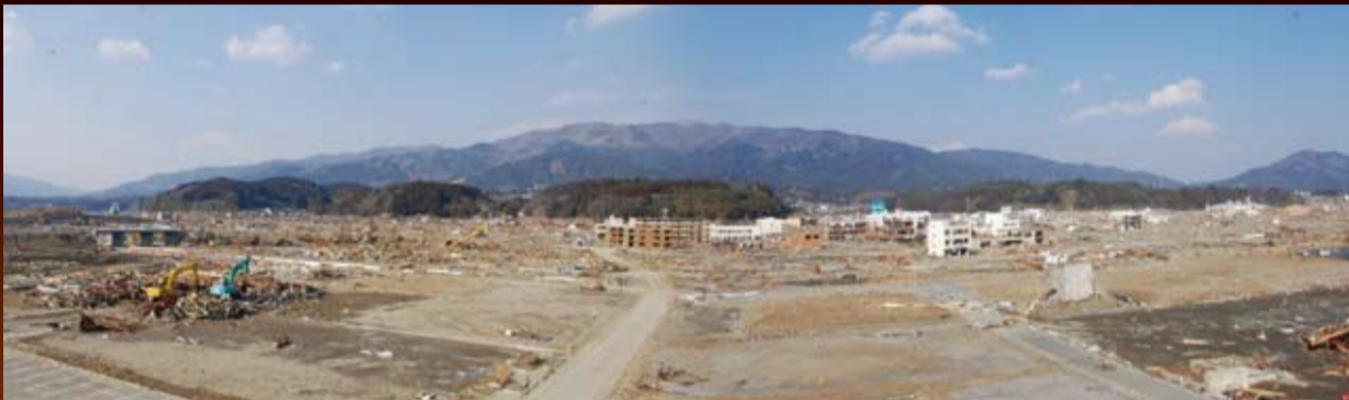
コンクリートの建物を残して壊滅状態になった岩手県陸前高田市

百年住宅グループでは「あらゆる災害から命と財産を守る」という企業理念のもと、巨大地震や台風、土砂災害の発生時に、ただちに社員を被災地に派遣しています。現地では被災者への物資の援助や義援金の寄託を行うとともに、住宅被害の実態調査・分析、現地に建つWPC住宅の確認を行い、さらなる強い家造りに活かしています。「住宅災害をなくすことで、社会に貢献する」。私たちはこの使命感に燃えています。